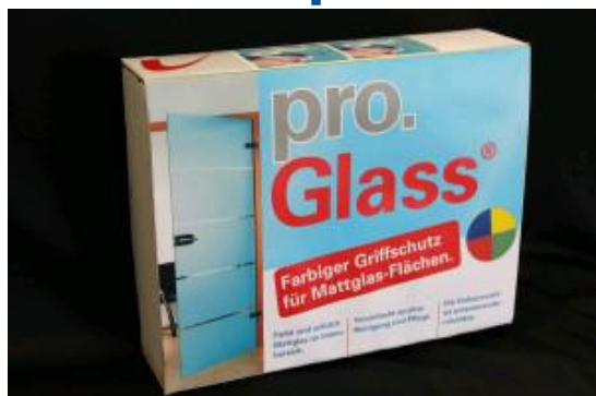
pro.Glass® Color Intensiv Box