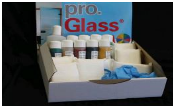
pro.Glass® Color Intensiv Box